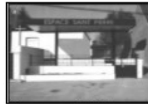
Espace St Pierre