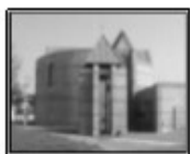
St Vincent de Paul

☎ 03.20.75.87.46 ou 03.20.70.41.56 stfrancoisparoisse@gmail.com