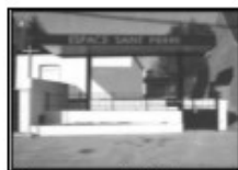
Espace St Pierre