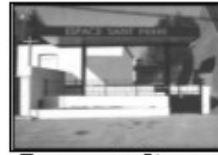
Espace St Pierre