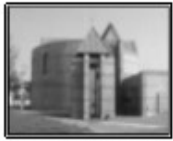
St Vincent de Paul

☎ 03.20.75.87.46 ou 03.20.70.41.56 stfrancoisparoisse@gmail.com