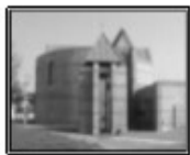
St Vincent de Paul

☎ 03.20.75.87.46 ou 03.20.70.41.56 stfrancoisparoisse@gmail.com