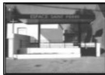
Espace St Pierre