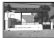
Espace St Pierre