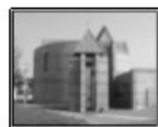
St Vincent de Paul

☎ 03.20.75.87.46 ou 03.20.70.41.56 stfrancoisparoisse@gmail.com