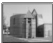
St Vincent de Paul

☎ 03.20.75.87.46 ou 03.20.70.41.56 stfrancoisparoisse@gmail.com