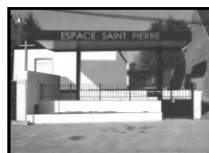
Espace St Pierre