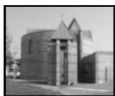
St Vincent de

☎ 03.20.75.87.46 stfrancoisparoisse@gmail.com