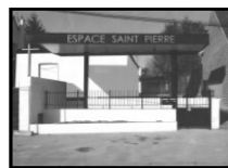
Espace St Pierre