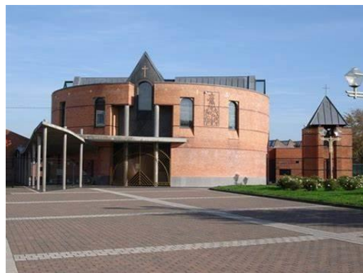
Saint Vincent de Paul