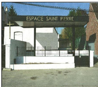
Espace Saint Pierre