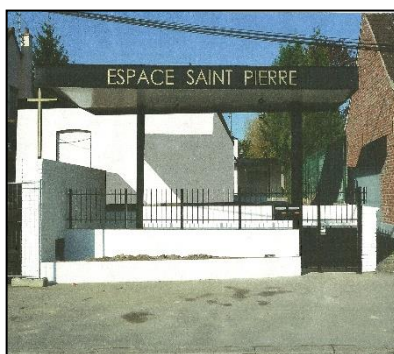
Espace Saint Pierre