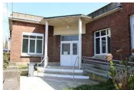
Espace Madeleine Delbrêl