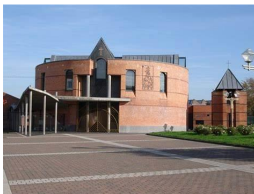
Saint Vincent de Paul