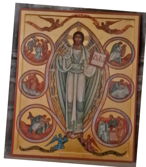
Pape François, Patris Corde

Salut, gardien du Rédempteur, époux de la Vierge Marie. À toi Dieu a confié son Fils ; en toi Marie a remis sa confiance ; avec toi le Christ est devenu homme. O bienheureux Joseph, montre-toi aussi un père pour nous, et conduis-nous sur le chemin de la vie. Obtiens-nous grâce, miséricorde et courage, et défends-nous de tout mal. Amen.