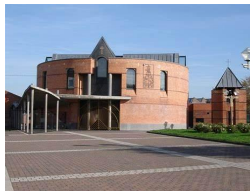
Saint Vincent de Paul