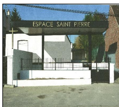
Espace Saint Pierre