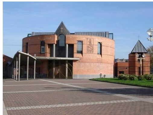
Saint Vincent de Paul