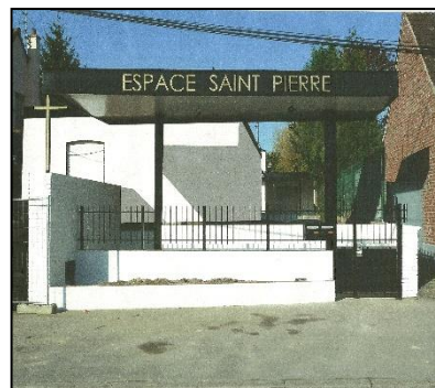
Espace Saint Pierre