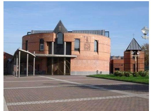
Saint Vincent de Paul