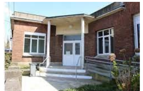
Espace Madeleine Delbrêl

@@@@@@@@@@@@@@@@@@@@@@@@@@@@@@@@@@@@@@@@@@@@@@@@@@@@@@@@@@@@@@@@@@@@@@@@@@@@@@@@@@@@